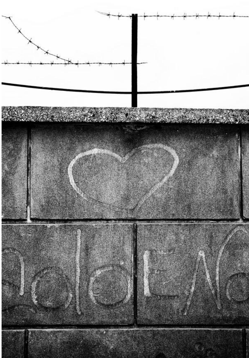
1° Classificato Alfonso Arana "Abbandono e degrado industriale"