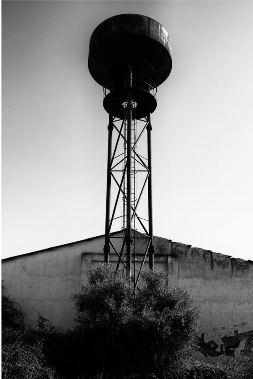
1° Classificato Alfonso Arana “Abbandono e degrado industriale”