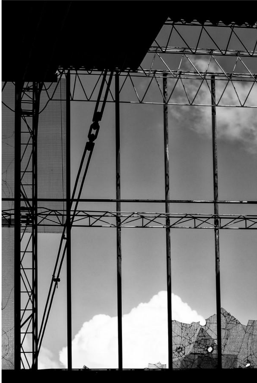
1° Classificato Alfonso Arana “Abbandono e degrado industriale“