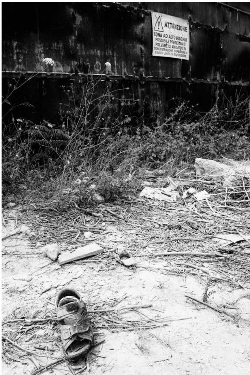
1° Classificato Alfonso Arana “Abbandono e degrado industriale”