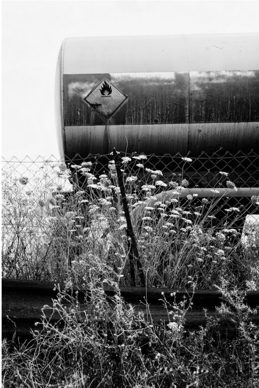
1° Classificato Alfonso Arana “Abbandono e degrado industriale”